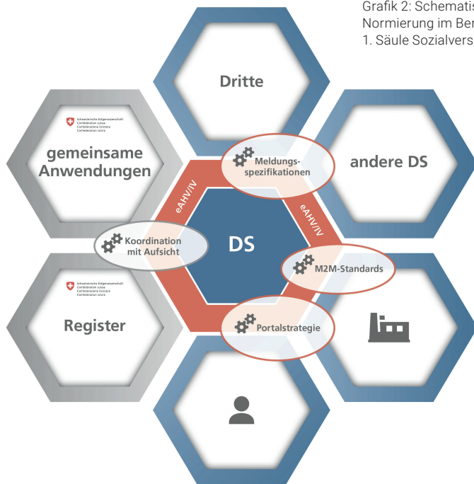
Grafik 2: Schematisch vereinfachte Darstellung der Standards und Normierung im Bereich Datenaustausch und Digitalisierung in der 1. Säule Sozialversicherung/FamZ

dass bereits heute über 30 Millionen Meldungen im Ökosystem der 1. Säule der Sozialversicherung elektronisch ausgetauscht werden.